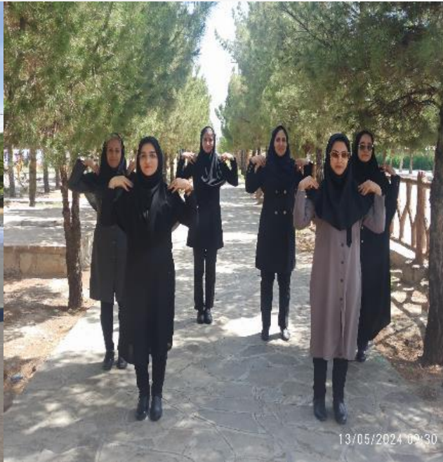
برگزاری پیاده روی و ورزش صبحگاهی