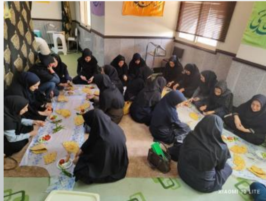
زیارت عاشورا و صرف صبحانه