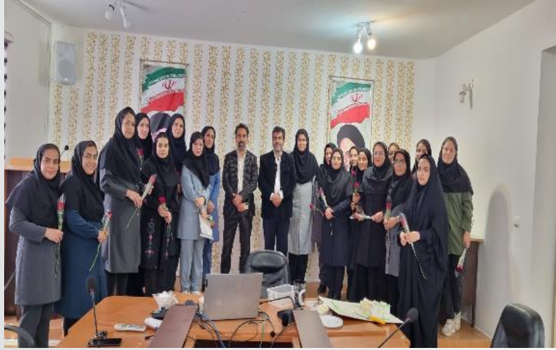
برگزاری جشن روز ماما در دهه کرامت