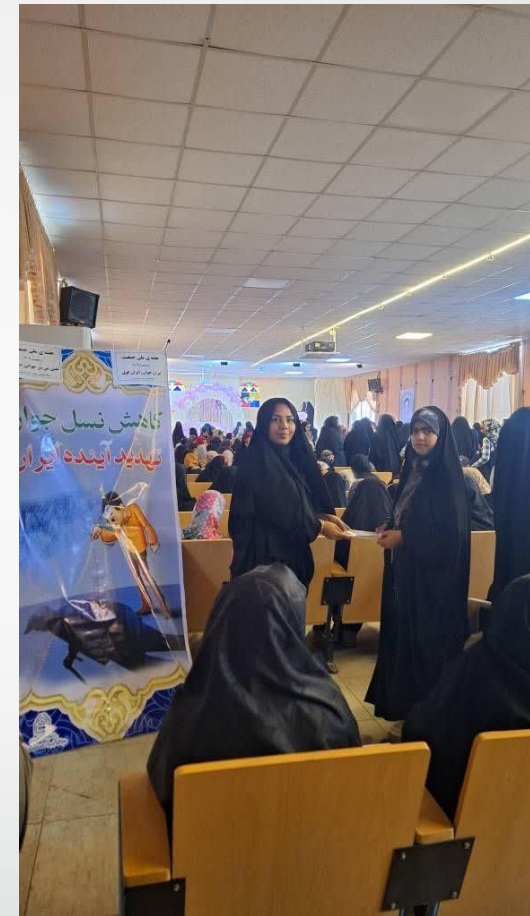
همکاری در برپایی جشن مادر دختری با سایر ادارات