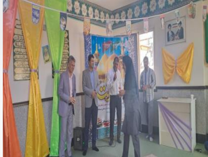
جشن دهه کرامت در بیمارستان شهید سید مصطفی خمینی