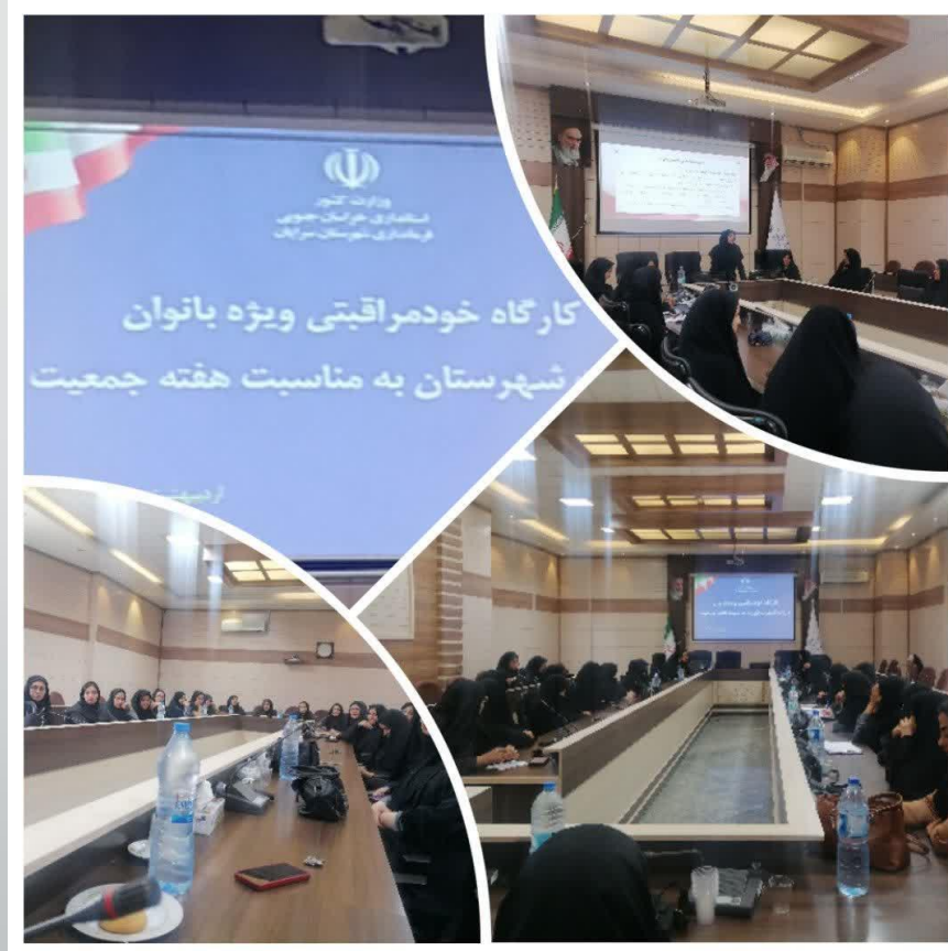
کارگاه آموزشی خود مراقبتی ویژه بانوان