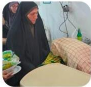
حضور خدام آستان مبارک حسین بن موسی الکاظم (ع) و بسیج جامعه زنان ناحیه طبس به همراه پرچم منبرک به حرم امام رضا (ع) و عبادت از بیماران به مناسبت دهه کرامت