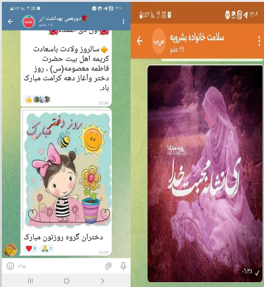
ارسال پیام تبریک در فضاهای مجازی شبکه بهداشت و درمان به مناسبت تولد حضرت معصومه (س) و روز دختر