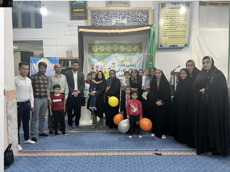
برگزاری جشن خواهر برادری به مناسبت دهه کرامت و هفته جمعیت